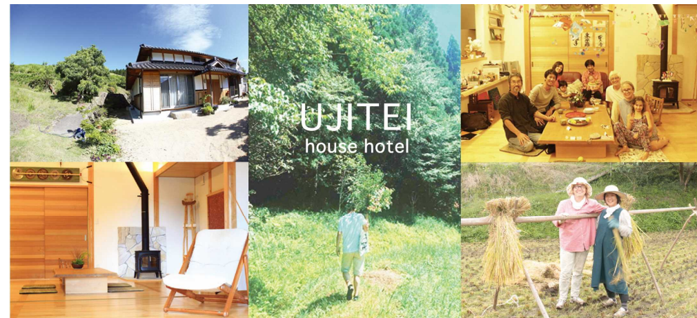
上：宿泊施設外観 下：リビング