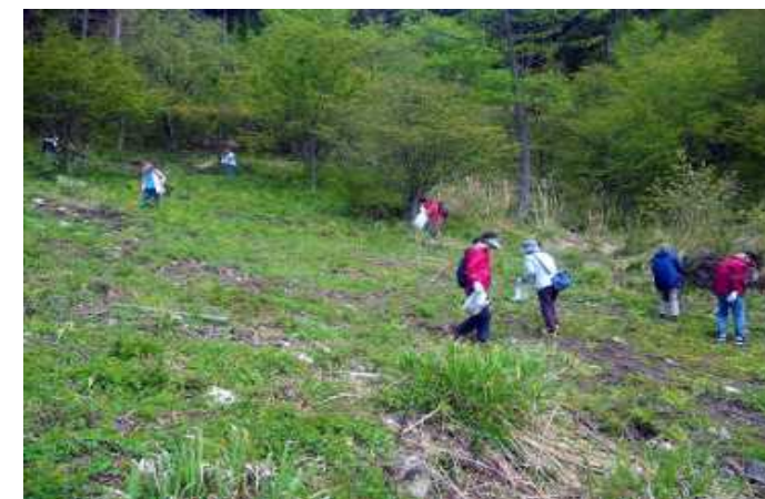
山菜トレッキング