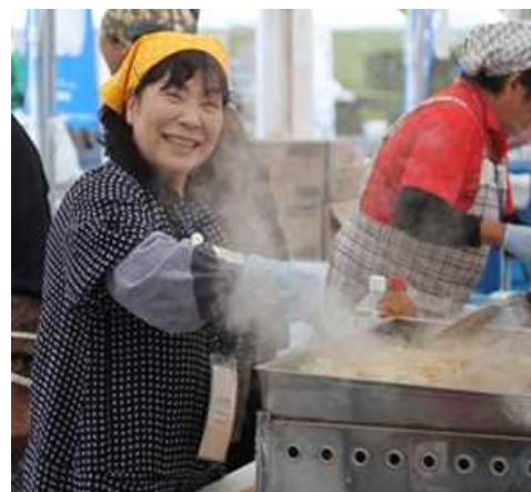
自然体で宿泊者を迎えるオーナー