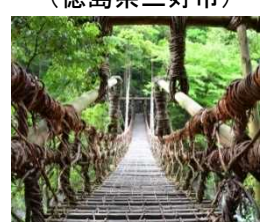
美しい日本の原風景(かずら橋や茅葺屋根など)が残る祖谷