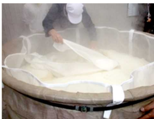
伝統継承 地酒づくり