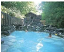
1) 蔵王温泉 (山形県山形市)