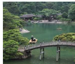
ミシュラン三ツ星に格付け。日本を代表する大名庭園として国内外に有名