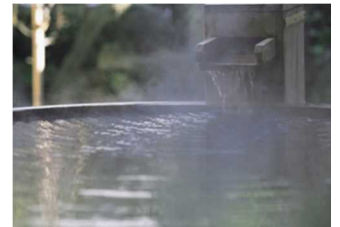
約 1200 年の歴史を持つ温泉