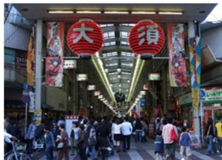
名古屋を代表する商店街