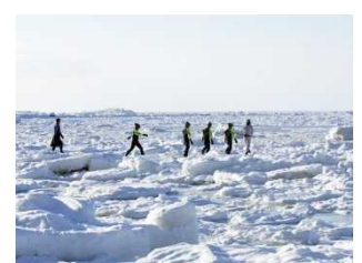
流水の上を歩く流氷とともに浮かぶ 知床国立公園は、世界遺産、ミシュラン三つ星