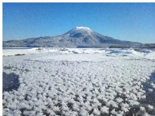
厳寒の湖に咲き誇る冬の華 阿寒湖はミシュラン三つ星