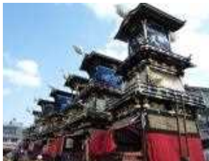
国指定重要無形民俗文化財