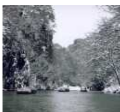
5) 狢鼻溪舟下り (岩手県一関市)

世界遺産。約 900 年前に建てられた中尊寺金色堂には、ミイラ化した亡骸が納められている。