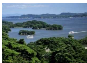
3) 日本三景・松島 (宮城県松島町)

ミシュラン三ツ星。世界で最も美しい湾クラブ。約 900 年もの昔から偉人に親しまれてきた日本三景。海に浮かぶ多島美を楽しめる。