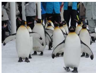
動物のありのままの姿を知る行動展示