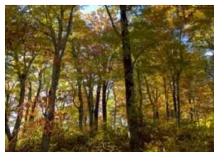
7) 白神山地 (青森県西目屋村ほか)