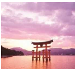
世界遺産。トリップアドバイザーで外国人に人気のスポット第3位