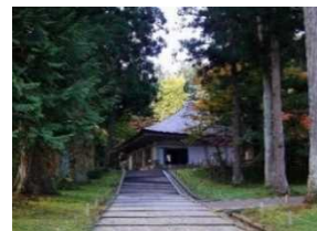
4) 平泉 (岩手県平泉町)

世界遺産。約 900 年前に建てられた中尊寺金色堂には、ミイラ化した亡骸が納められている。