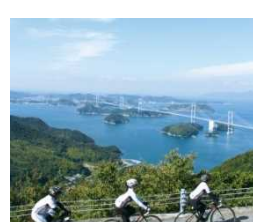
CNNにより世界7大サイクリングコースにも選ばれたしまなみ海道。車またはサイクリングでの移動も可