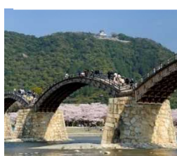
日本三名橋の一つにも数えられている錦帯橋。日本の匠ともいえる美しい構造