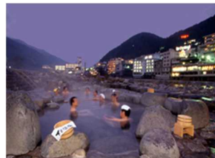
日本三名泉の一つ