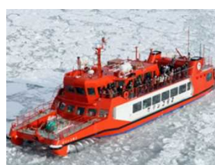
流氷を砕き、割り力強く進む船