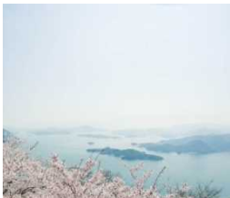
瀬戸内の美しい自然景観を各地で楽しめる