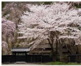
6) 角館 (秋田県仙北市)