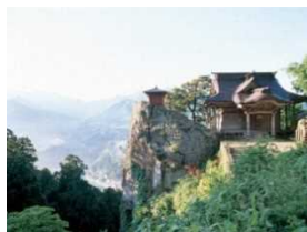
2) 山寺 (山形県山形市)

約 1,100 年前に開かれたお寺。山門から奥の院までの石段は 800 段を超える。