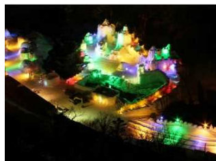
七色に照らされる数々の巨大な氷像