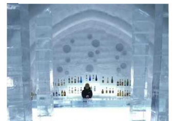
氷上に出現する冬だけの村