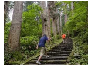
8) 羽黒山 (山形県鶴岡市)

ミシュラン三ツ星。約 1,400 年前に開かれた修験の山。山頂付近の五重の塔は国宝に指定。