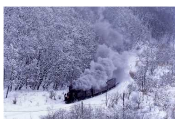
一面の銀世界を走る漆黒の機関車