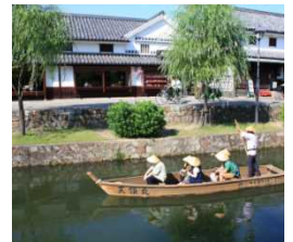
白壁の美しい町並みが残る倉敷。交通の大動脈であった瀬戸内の文化・歴史が感じられる