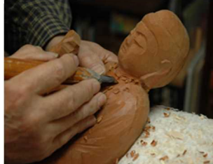
銘木仔イで作られる木工彫刻 国の伝統工芸品