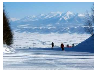
全国屈指のパウダースノー