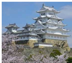
世界遺産。平成の大修理を終え、ますます美しい姫路城