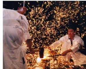
関鍛冶の技を 今に伝える施設